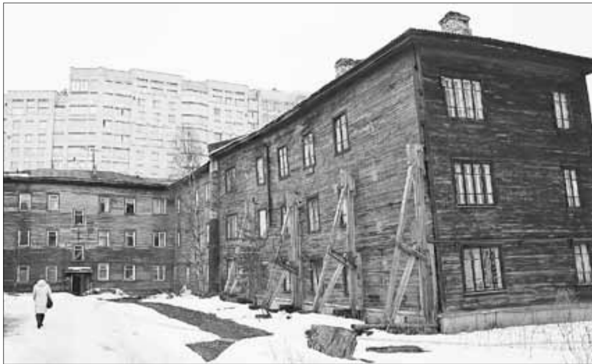
■ В Архангельске много деревянных домов, требующих расселения.

Но это только на первый взгляд. Существуют судебные решения о предоставлении жи-