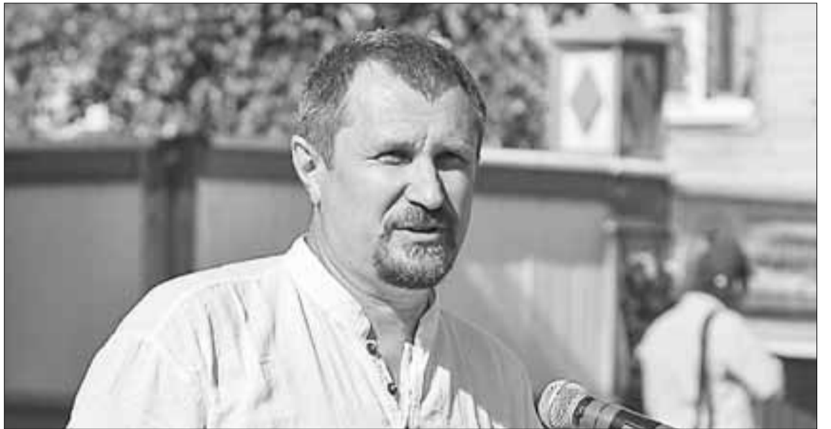
■ Господин Якорский почему-то умалчивает, что в годы своей работы главным архитектором города он и сформировал облик, который мы сейчас имеем, с теми самыми гаражами в центре города

страимых противоречий между проектами планировок центральной части Архангельска и территории в границах пр. Ломоносова – ул. Романа Куликова – набережная Северной Двины нет.