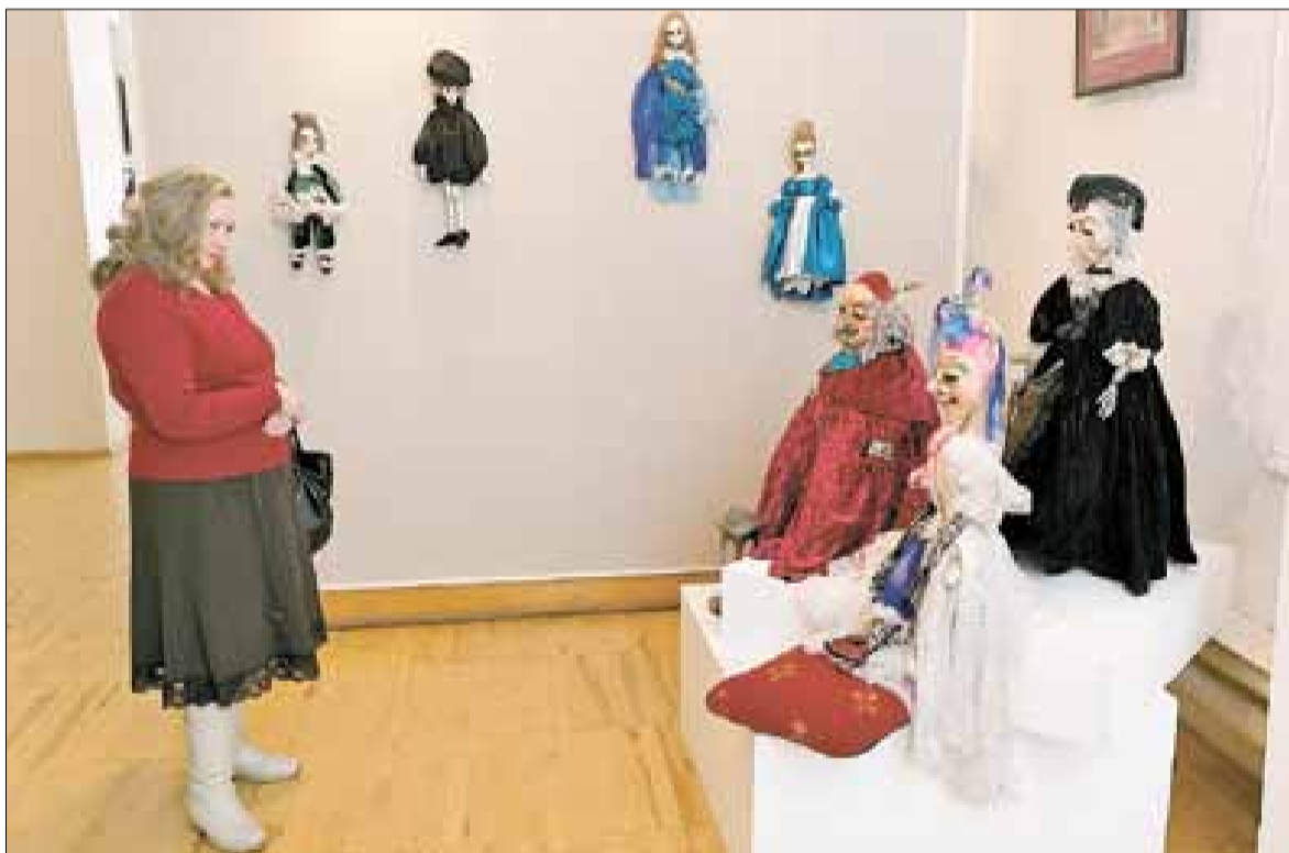
■ Каждую куклу можно рассмотреть в мельчайших деталях.

– В собрании музея театра кукол имени Образцова более четырех тысяч экспонатов из разных стран мира, – рассказывает Надежда Михайловна. – Мы ре-