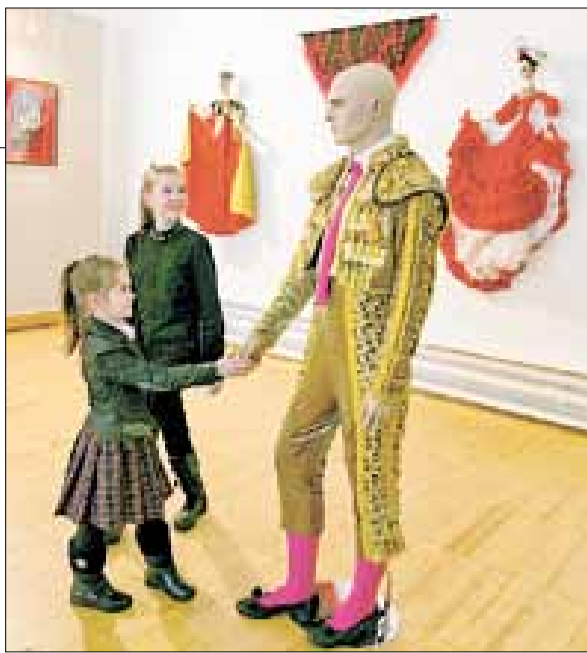
■ Сценический костюм артиста.