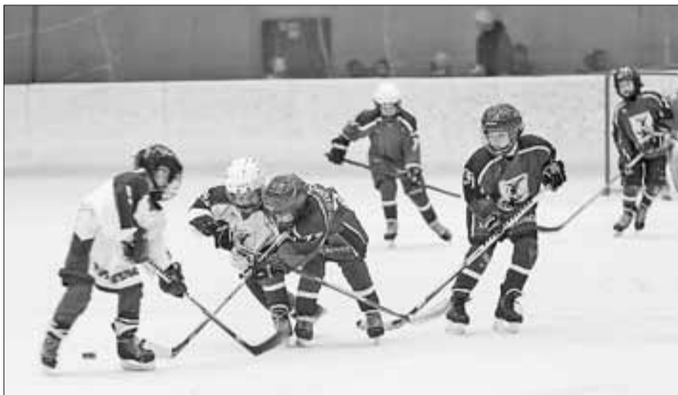
■ Матчи турнира были непредсказуемыми.

Спорт: В столице Поморья прошел областной турнир по хоккею с шайбой на призы обладателя Кубка Стэнли Дмитрия Афанасенкова