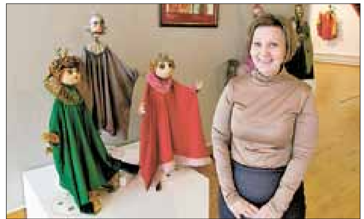
■ Надежда Фадеева: «Мы стремились к тому, чтобы выставка была интересна не только детям, но и взрослым».