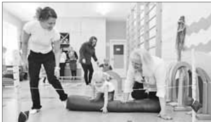
■ Адаптационная группа «Крошка»: совместные игры-занятия для родителей и детей, не посещающих детский сад

родского бюджета выделено 1,5 миллиона рублей. В группах обновлена мебель, игровое оборудование. По специальной муниципальной программе совершенствования и модернизации системы питания в муниципальных образовательных учреждениях Архангельска приобретено технологическое оборудование для пищеблока: жарочный шкаф, электрокотел, фильтры для очистки воды, холодильный шкаф.