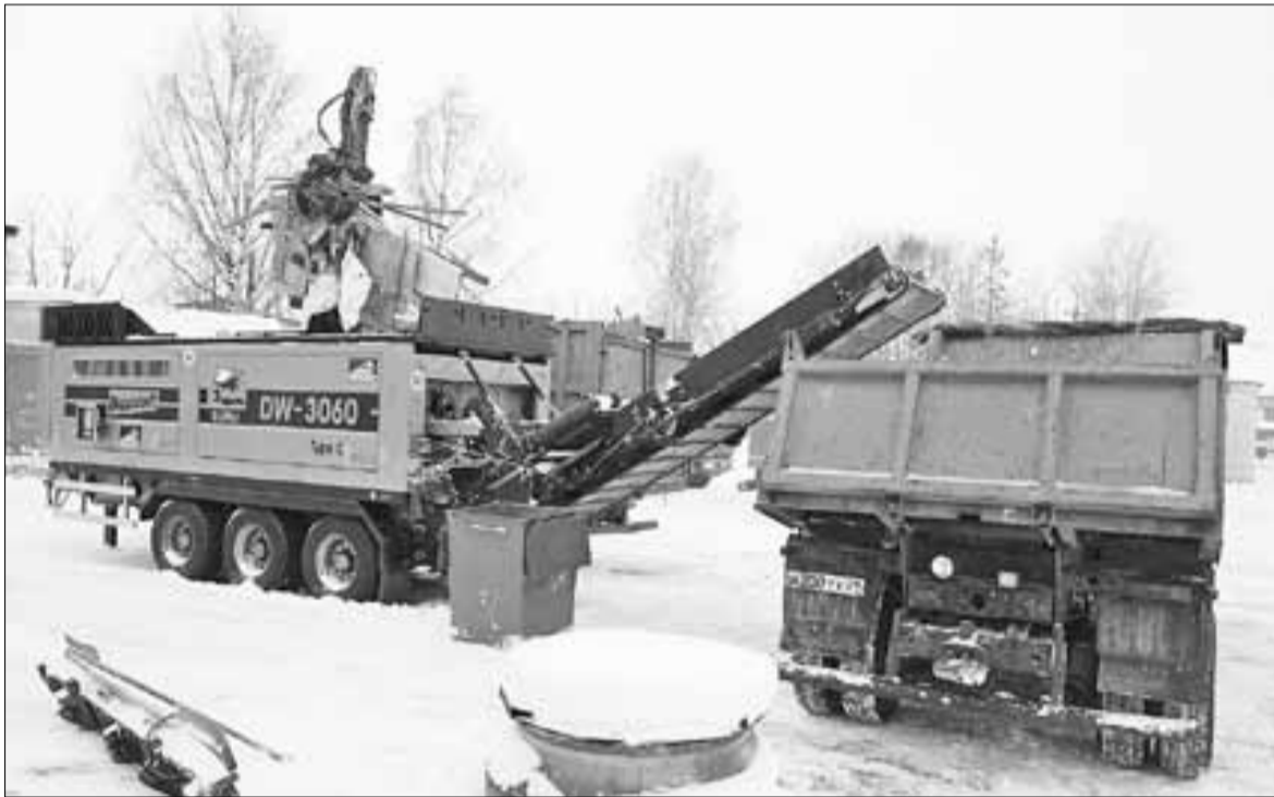
■ Для решения проблемы вывоза мусора МУП «Спецавтохозяйство» приобрело мобильный измельчитель бытовых отходов.