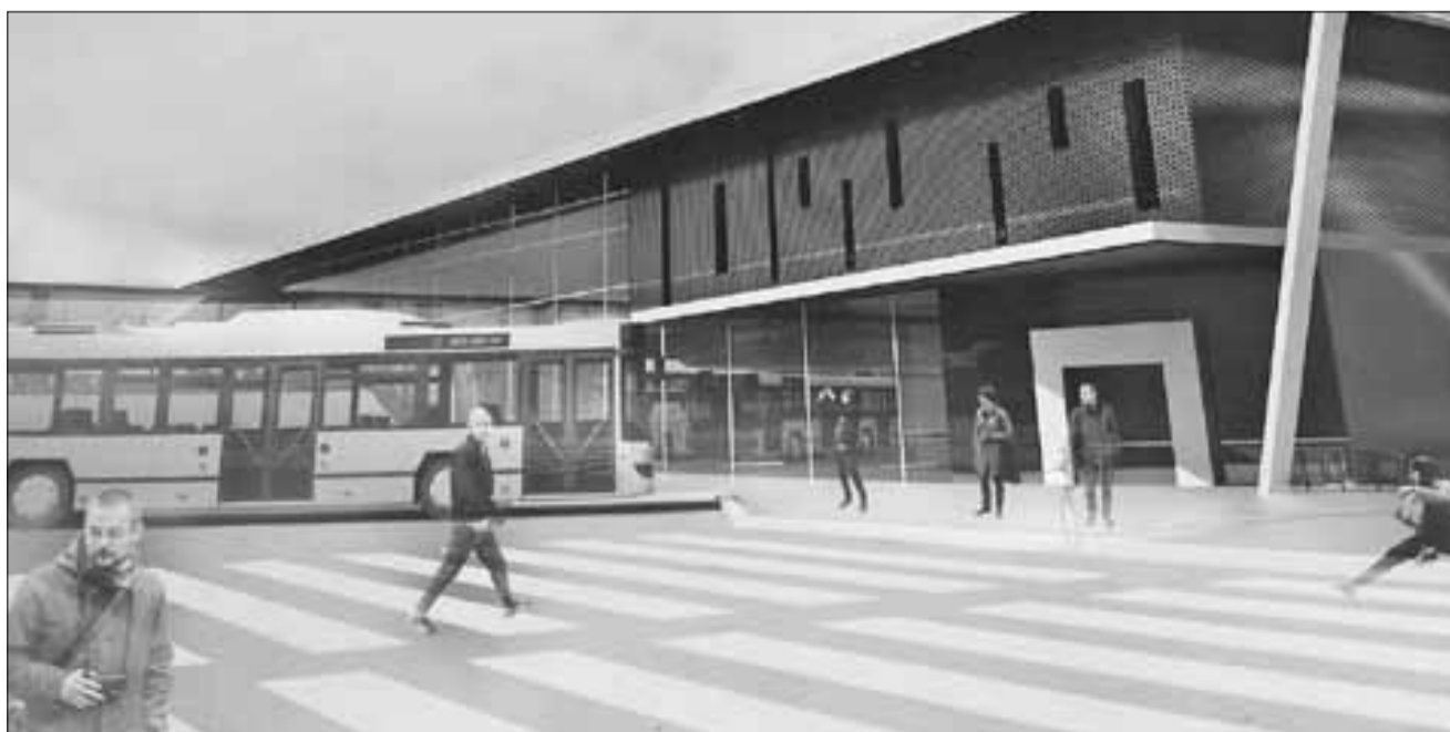
■ Один из предложенных проектов, как может выглядеть транспортный терминал