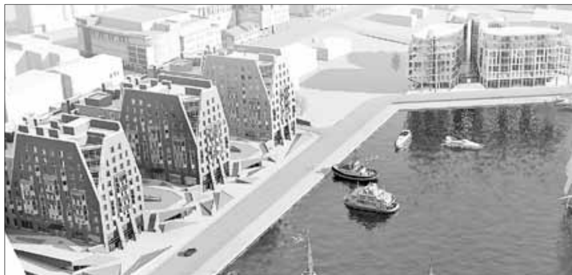
■ Проект жилого комплекса «Омега-хаус» и бизнес-центра «Дельта» получил престижные награды: золотой диплом смотра-конкурса «Архитектон» и премию «Золотой знак» на фестивале «Зодчество-2012»

– Сегодня по крайней мере в четырех или пяти российских городах возникла аналогичная, очень напряженная ситуация. Связано это с неспособностью людей слышать друг друга. Причина – столкновение разных интересов. И все же должен сказать, что Архангельск не травмирован так, как травмированы многие другие российские города в условиях хаотичной застройки